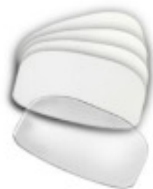
11-0319: Ersatzfenster, 5 Stk. Ein beschädigtes Fenster kann vom Benutzer ausgetauscht werden. Der Scanner muss nicht zur Reparatur eingeschendet werden.