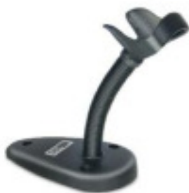
STD-QD20-BK: Ständer für Halter für Freihandbetrieb Auch in weiß erhältlich.